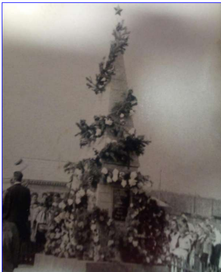
1.Первый обелиск в селе Костыгин Лог 1965 – 1967 гг.