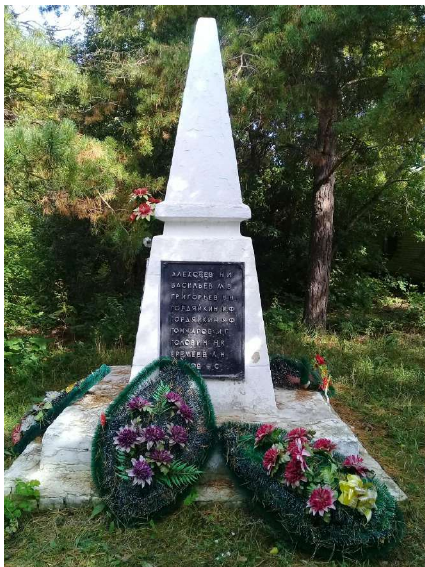
Обелиск в деревне Пруды 2019 г.