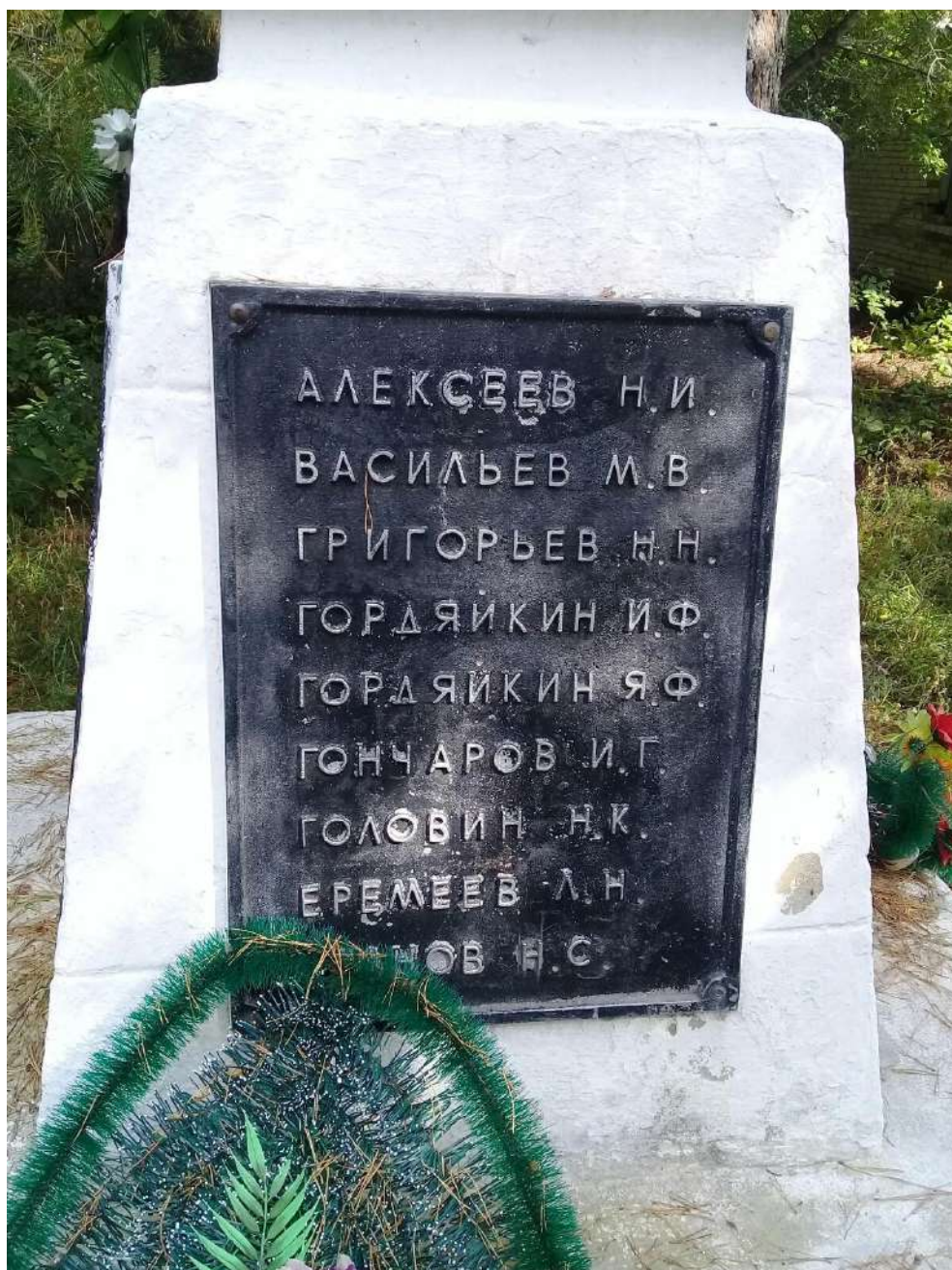
4. Имена павших воинов деревня Пруды