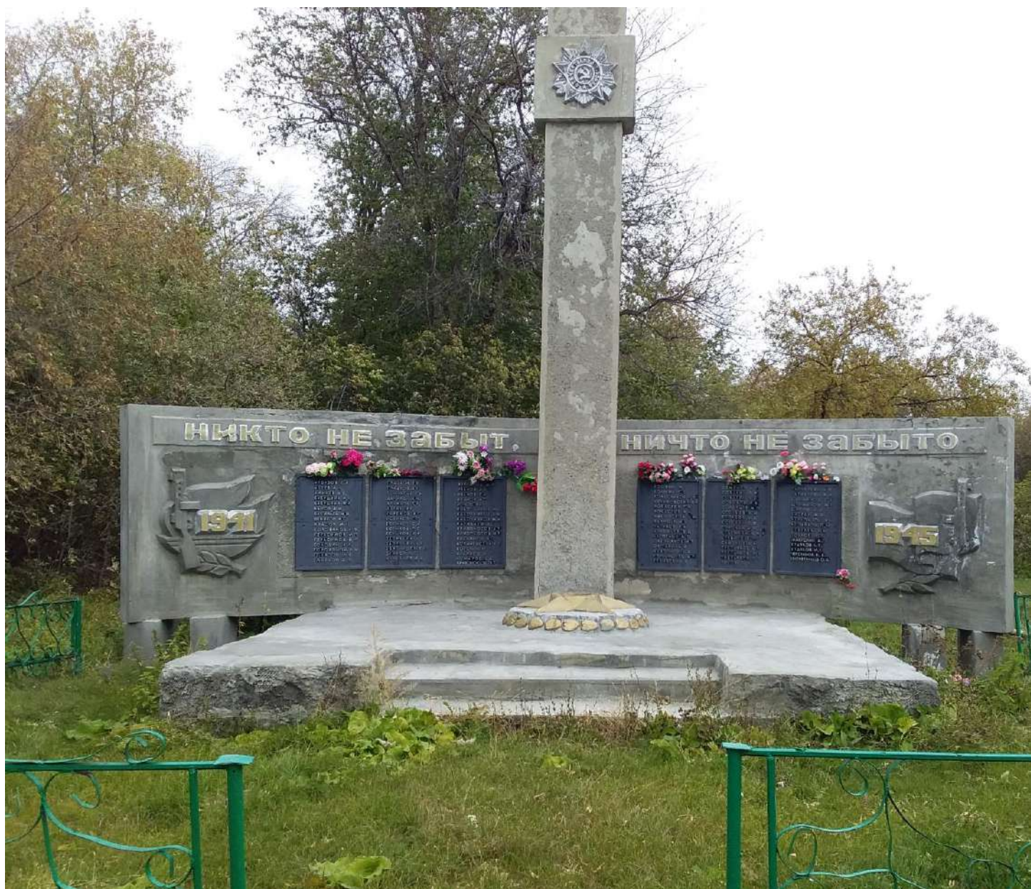
2. Стелла погибшим воинам села Костыгин Лог 1975 гг. – наши дни.