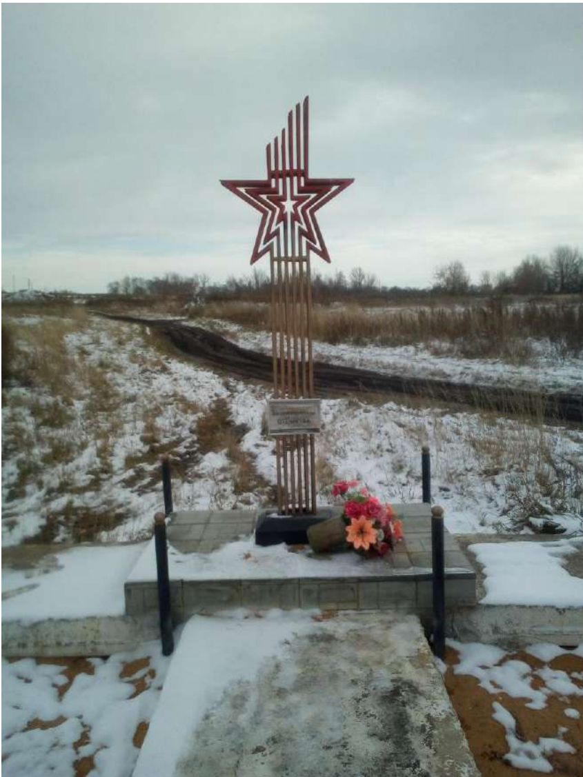
5. Памятник деревня Зелёная Сопка 2019 год