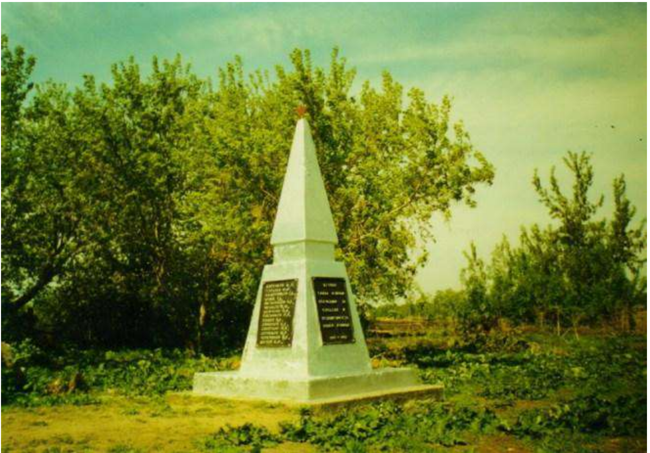
3. Обелиск павшим землякам деревня Марс 1975 г.