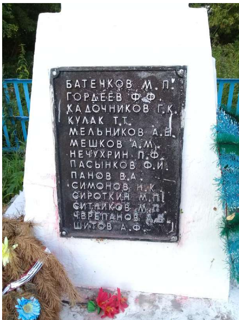
4. Имена павших деревня Марс