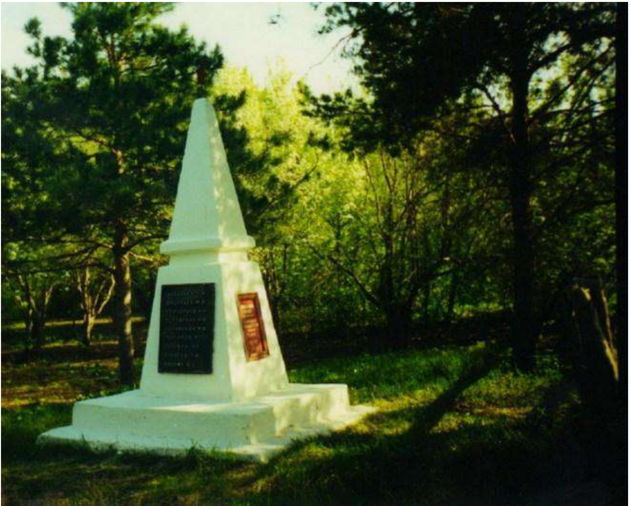
Обелиск павшим землякам в годы Великой Отечественной войны 1975 г. Деревня Пруды